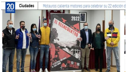
Motauros calienta motores para celebrar su 22 edición del 20 al 23 de enero con el lema 'El reencuentro'

El desgarrador mensaje del vallisoletano que sí derrotó al Sarcoma de Erwing: "Que